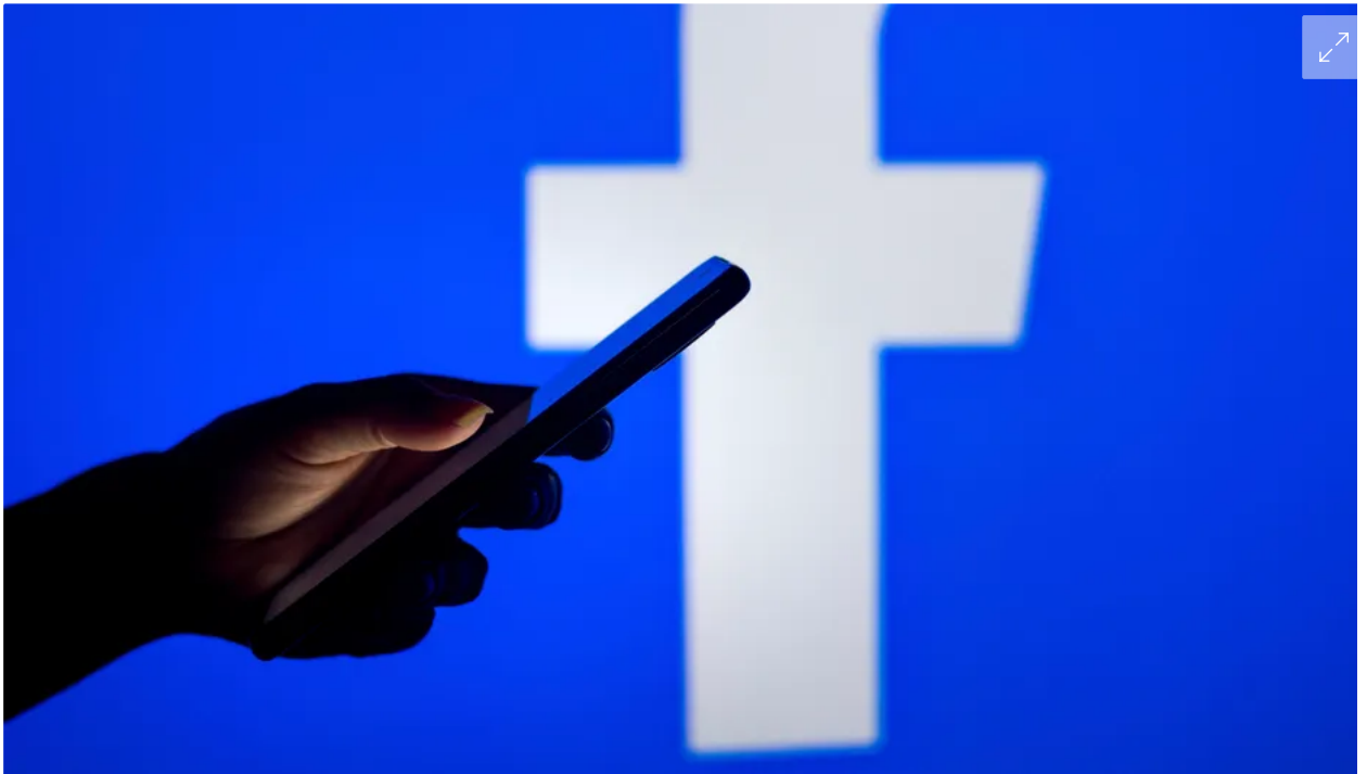
Facebook (Symbolbild): Klobige Sätze, kyrillische Worte

Auf Facebook und Twitter kursierten seit mehreren Wochen Links zu