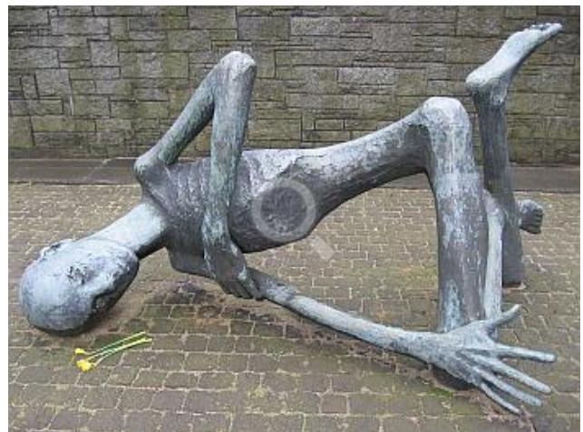
KZ Neuengamme Denkmal "Sterbender Häftling" von Francoise Salmon

Ende Januar 1941 wurde Vogler in das KZ Neuengamme bei Hamburg verlegt.