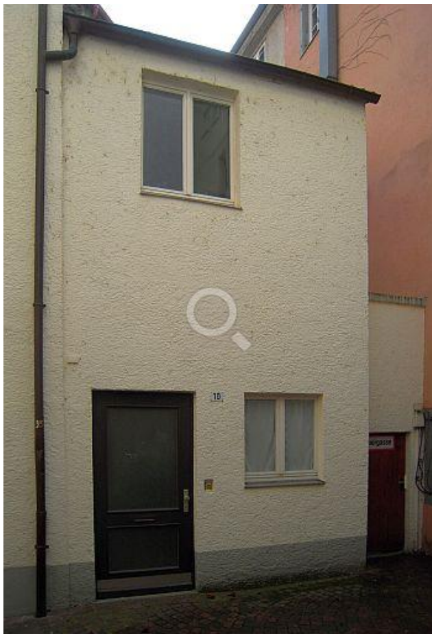
Hohenhausgasse 10 heute (2015)