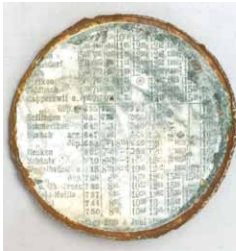
Eine Brosche, gefunden in der Nähe des Krematoriums von Auschwitz. Auf der Rückseite befindet sich ein Fahrplanausschnitt der Strecke Rapperswil-Schmerikon-Uznach.

Wyler blieb bis zur Räumung des Lagers am 18. Januar 1945 in Auschwitz. Auf einem der berühmtesten «Todesmärsche», als die Häftlinge nach Auflösung von Lagern wie Auschwitz unter brutalen Misshandlungen und unmenschlichen Bedingungen in noch bestehende andere Lager verlegt wurden, gelang ihm schliesslich die Flucht.